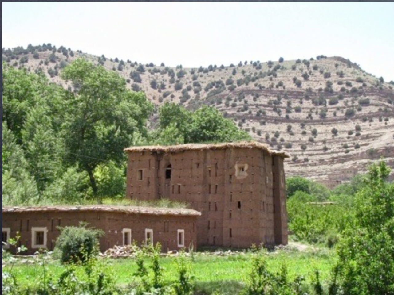
Greniers et aire de battage du grain