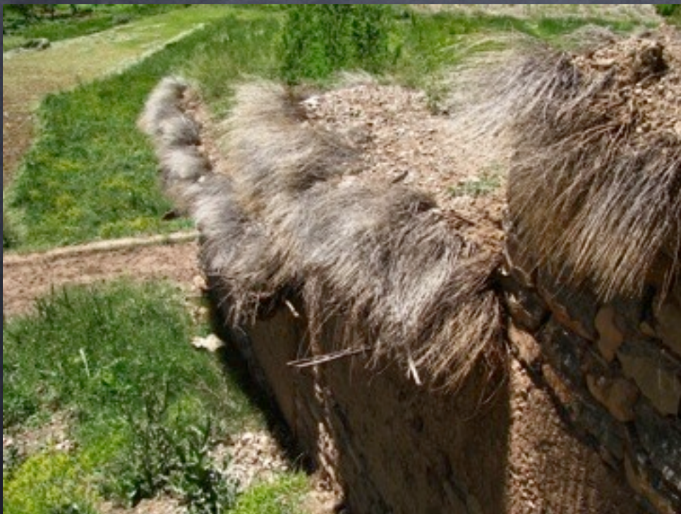
Détail d'un toit