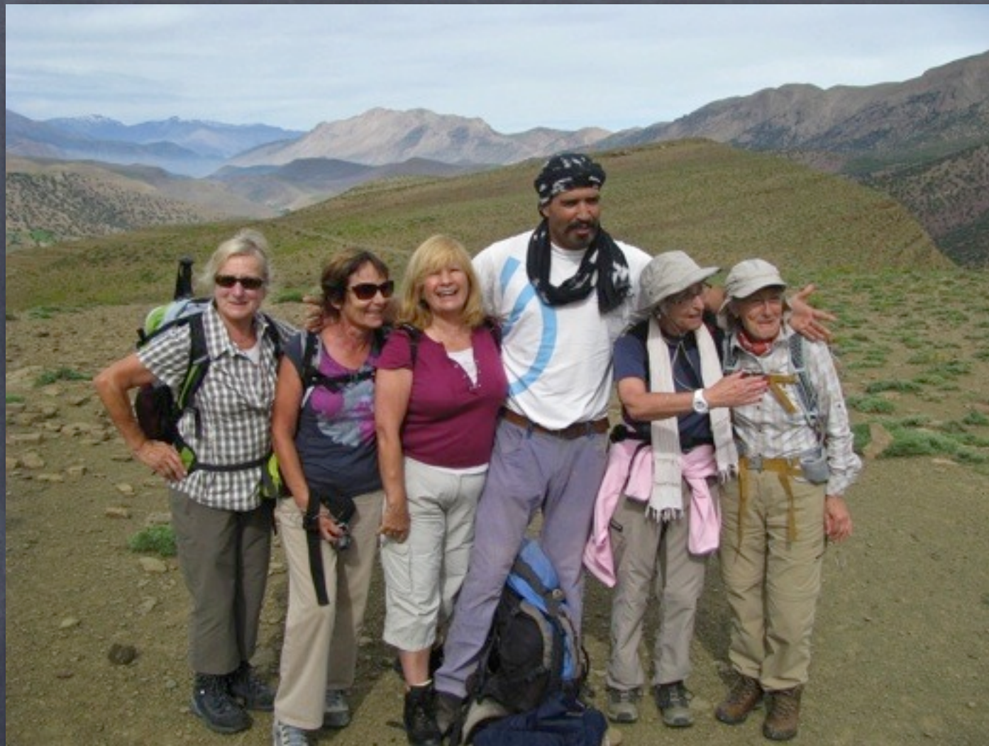
Autour du lac d'Izourar