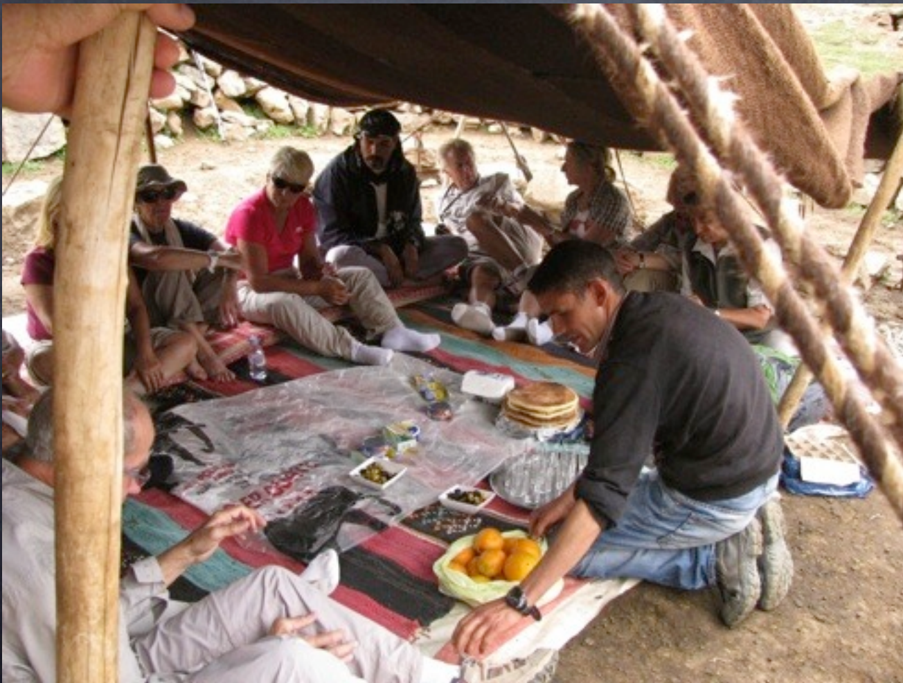
Chez les nomades Aït Atta